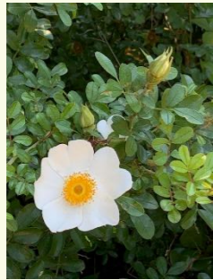
ぜひご覧ください。 「カカヤンバラ」

5～7cmの大きな白い花。江戸時代にフィリピンのカガヤンから伝わりました。猛暑にめげない姿を