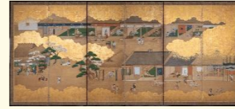
狩野宗信「職人尽図屏風」左