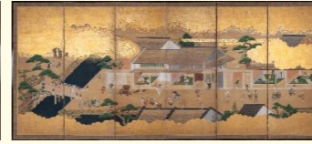
狩野宗信「職人尽図屏風」右